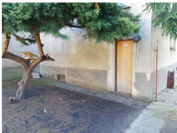
14. severozápadní nároží