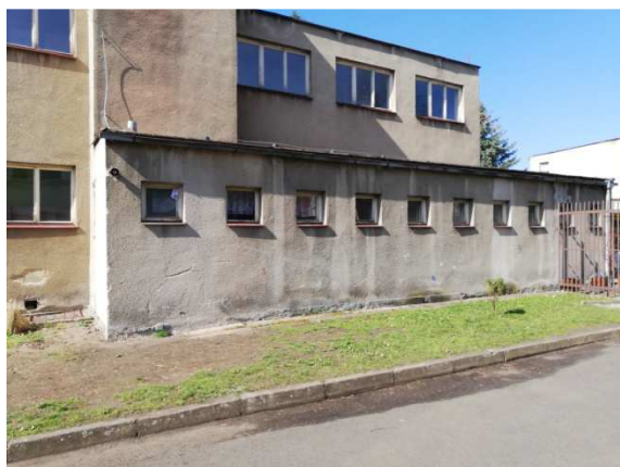
9. jednopodlažní přístavba