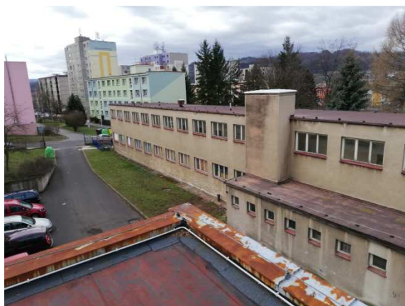
2. celkový pohled severovýchodní shora