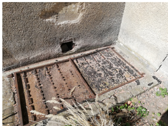
13. detail anglických dvorků