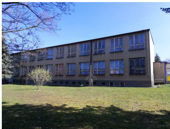
4. pohled jihozápadní