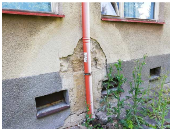
18. poškození omítky vlivem zatékání porušeným svodem