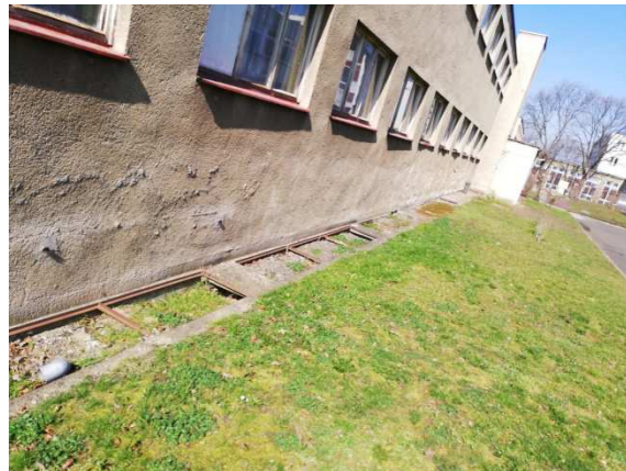
12. detail anglických dvorků