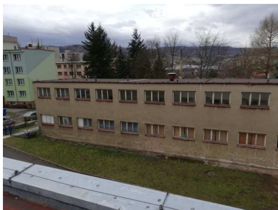
1. celkový pohled severovýchodní