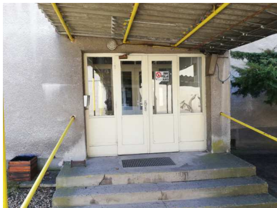
8. detail severního vstupu