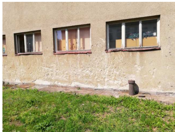
11. stav omítek východní fasády