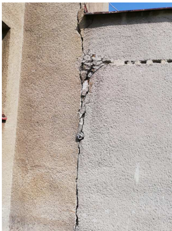
17. detail odtržení zdiva přístavby od komínového zdiva