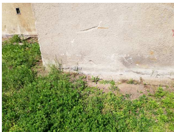
19. vzlínající vlhkost v místě syku s terénem