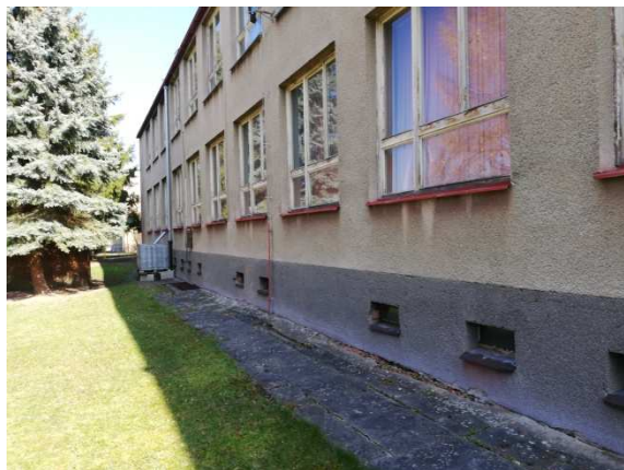
7. pohled jihozápadní