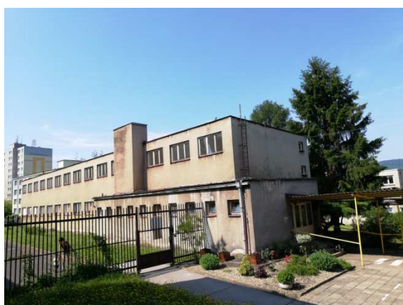
3. celkový pohled severovýchodní