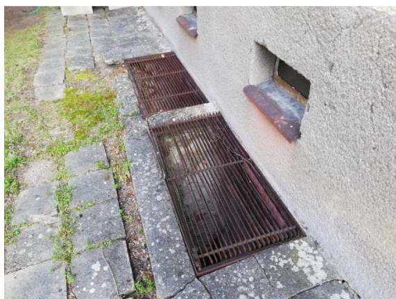
16. detail okapových chodníčků podél západní fasády