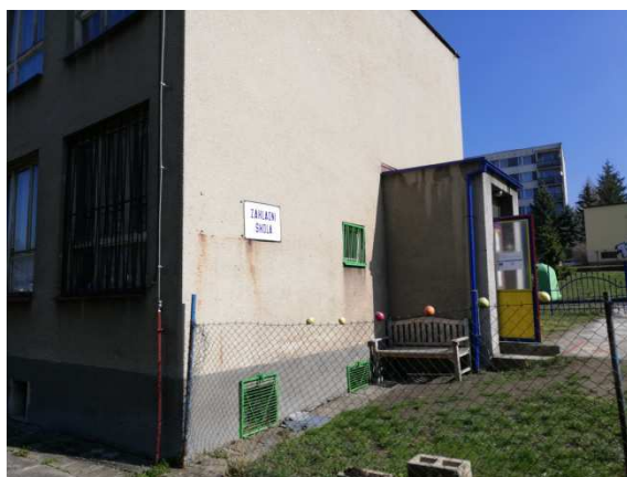
5. pohled jihozápadní